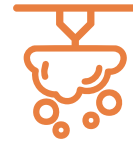
Köpüklü Söndürme Sistemi