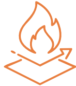
Yangın Durdurma Yalıtım Uygulamaları